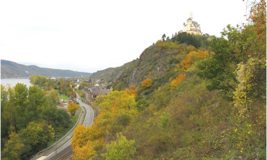
Blick zurück nach Braubach mit der Marksburg

die Mehrheit wohl dafür, aber ein Teil noch unentschlossen. Immerhin droht die Aberkennung des Titels UNESCO-Weltnaturerbe. Beim Abendspaziergang finde ich die Burg Rheinfels und St.Goar`s Kirchen gegenüber wunderbar beleuchtet. Durch eine Büste wird in St. Goarshausen Heinrich Heine (1797-1856), Schöpfer des berühmten Lied-Textes „Ich weiß nicht, was soll es bedeuten.....“ , des sogenannten Loreley-Liedes, geehrt.