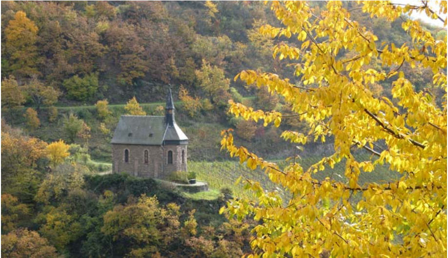
Die Clemenskapelle bei Lorch

daher vielerorts umgeleitet ist, nehme ich lieber den Zug nach Rüdesheim um in nördlicher Richtung zu marschieren.