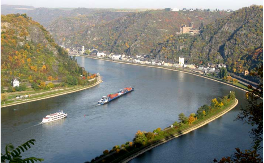
Loreley-Blick nach Norden mit Burg Katz am rechten Ufer