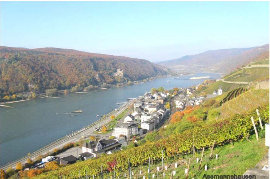
Durch die Weinberge hinab nach Assmannshausen Winfried Oster