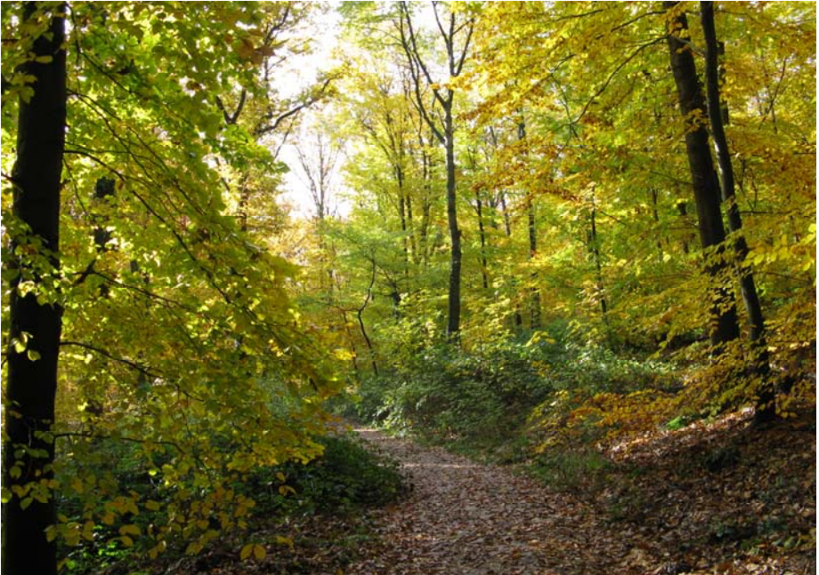
Auf dem Weg nach Assmannshausen