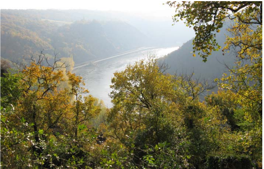
Blick von der Loreley in südliche Richtung

ich wenige Kilometer vor Lorch die „Grenze“ von Hessen, zum Rheingau, passiere. Durch Weinberge bummele ich hinunter zum Ort. Da zwischen Lorch und Assmannshausen zurzeit Jagdbetrieb stattfindet, der Rheinsteig