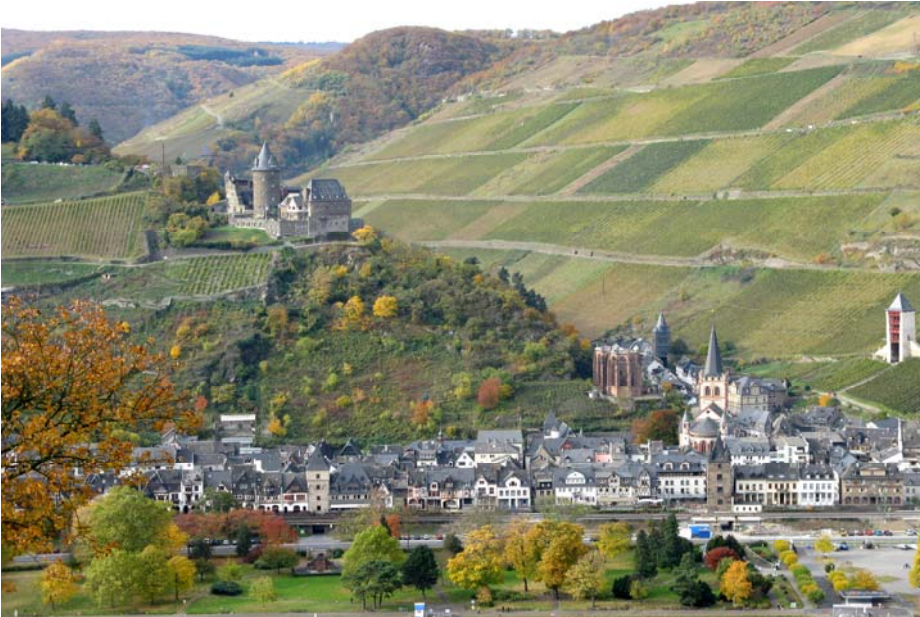
Blick auf Bacharach am linken Rheinufer