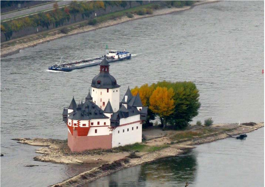
Die weltberühmte Burg Pfalzgrafenstein im Rhein bei Kaub